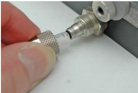
Abb. 2: Vakuumschlauch anschließen